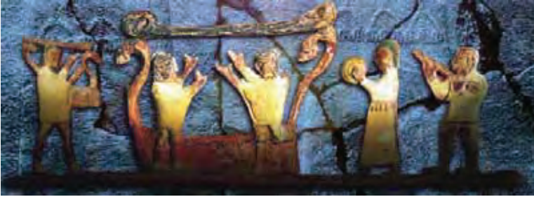
Hitit Vazosu-detay / Hittite vase-detail

1-23 Ağustos arasında festival süresince sürecek olan bu sergi, 2009 AB Kaleidoscope Europe 'ca desteklenen Hattusha projesince yeniden üretilen müzik enstrümanlarını sunmaktadır. Bu sazlar ODTÜ'de arkeolojik buluntular üzerinde yapılan çalışmalara dayanarak, İTÜ-TMDK Müzikoloji Bölümünden uzman akademisyen lüthiyeler tarafından yeniden üretilmiştir. 8 Ağustos'da orjinal projeyi üretenlerden, İTÜ'den Tunç Buyruklar ve 2 müzisyen, İTÜ-TMDK Müzikoloji Bölümü ve MIAM başkanı, arpist Prf. Şehvar Beşiroğlu ve bağlama uzamanı Okan Murat Öztürk aramıza katılıp bu heyecan verici proje üzerine bizleri bilgilendirecek ve sazlar ile örnek müzikler sunacaklar.