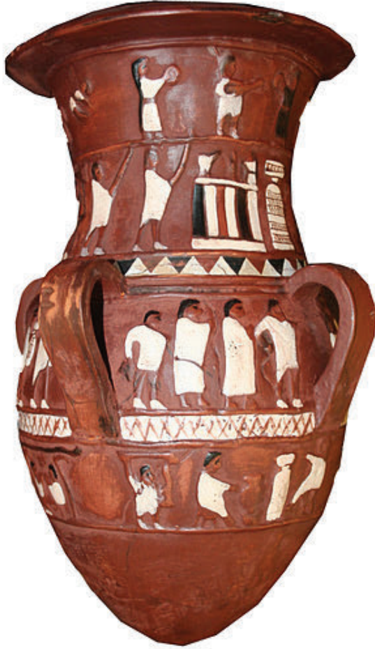
Kapaktaki Hitit Lir'inin orjinal görsel kaynağı olan İnandık Hitit Vazosu Ankara Anadolu Medeniyetleri Müzesi